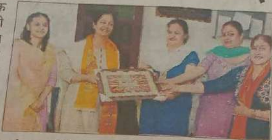
वर्कशाप मौके का दृश्य।