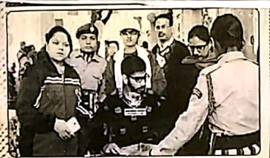
ਮਾਡਲ ਪੋਲਿੰਗ ਬੁਥ ਦਾ ਦ੍ਰਿਸ਼।