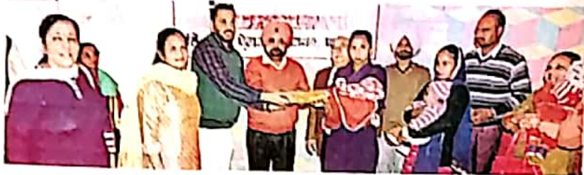
ਨਵਜਨਮੀ ਬੇਟਿਯੋ ਖ ਮਾਤਾओं ਕੋ ਸਮਮਾਨਿਤ ਕਰਨੇ ਹੁਏ।