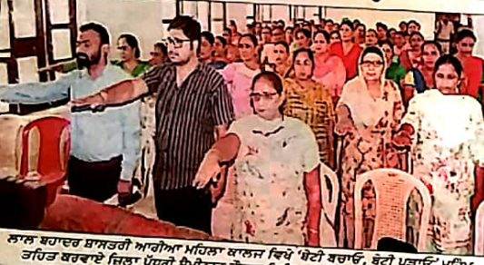
ਲਾਲਾ ਬਹਾਦਰ ਸ਼ਾਸਤਰੀ ਆਗੀਆ ਮਹਿਲਾ ਕਾਲਜ ਵਿਖੇ 'ਬੇਟੀ ਬਚਾਓ, ਬੇਟੀ ਪੜ੍ਹਾਓ' ਮੁਹਿੰਮ ਤਹਿਤ ਕਰਵਾਏ ਜਿਲਾ ਪੱਧਰੀ ਸੈਮੀਨਾਰ ਦੌਰਾਨ ਵਿਦਿਆਰਥੀ ਸਹੁੰ ਚੁਕਦੇ ਹੋਏ।