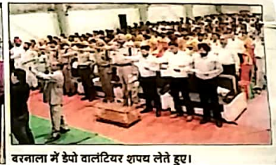
बरनाला में डेपो वालंटियर शपथ लेते हुए।