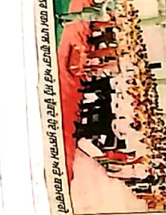
बरनाला में डेपो वालंटियर शपथ लेते हुए।