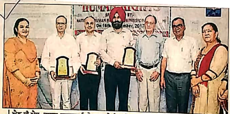
• अल.बी.एस. बरनाला विधे करवाये एक रोज़ा मनुषी अधिकार प्रोग्राम दैरान बरनाला एल.बी.एस. कॉलेज में।