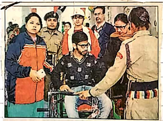
1) ਸ੍ਰੀ ਐਲ.ਬੀ.ਐੱਸ. ਆਗੀਆਂ ਮਹਿਲਾ ਕਾਲਜ ਦੇ ਵਲੰਟੀਅਰ ਅਪਾਹਜ ਨੌਜਵਾਨ ਨੂੰ ਵੋਟ ਪਾਉਣ ਲਈ ਲਿਜਾਏ ਹੋਏ।