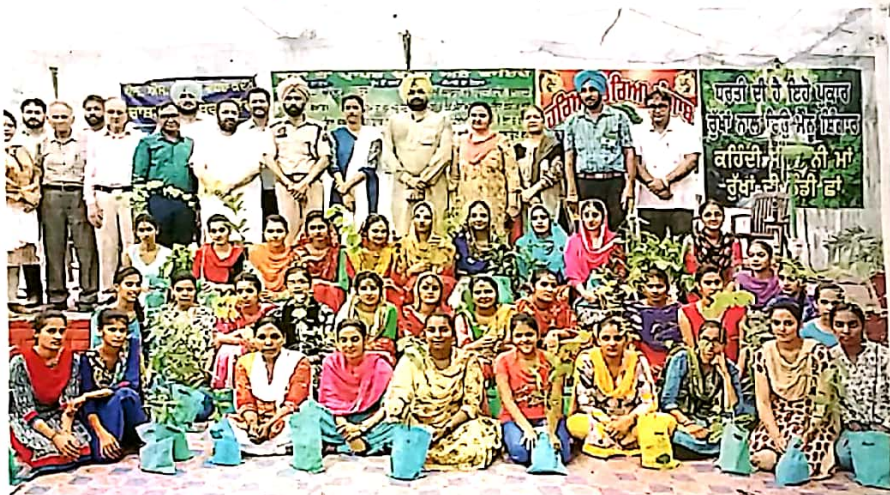
एलबीएस कॉलेज बरनाला में करवाए पर्यावरण संबंधी कार्यक्रम के दौरान कॉलेज प्रबन्धक, गणमान्य व छात्राएं। (इसेट) एलबीएस कॉलेज बरनाला में पौधरोपण करते हुए एसएसपी बरनाला व अन्य अधिकारी