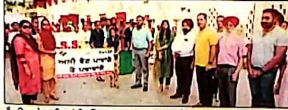
रैली को हरी झंडी दिखाकर रवाना करते हुए।