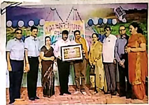
एलबीएस कॉलेज बरनाला में गणमान्य को सम्मानित करते हुए कॉलेज के प्रबंधक • जगदरूप