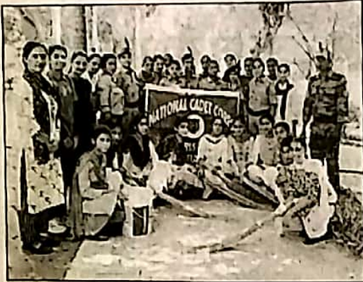
एलबीएस आर्य महिला कॉलेज के एनसीसी छात्र पार्क की सफाई करते हुए।